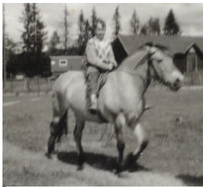
Tilfeldig bruk av hest?