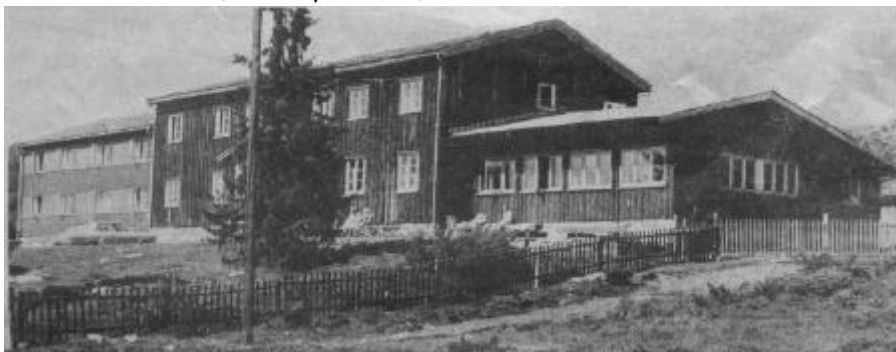
Loftsgård var det første turiststed på Mysusetet, og ble bygget i 1900 med en kapasitet på 25 gjester. I 1960-årene ble fløyen til venstre bygget, og nå har stedet en sengekapasitet på henimot 60