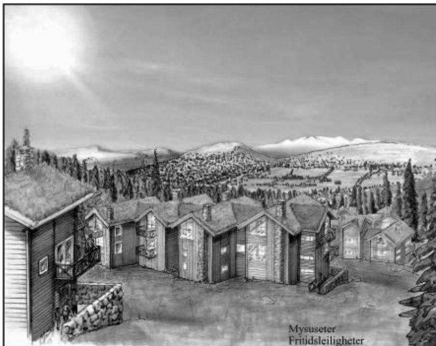
Slik har arkitekten tenkt seg leilighetskomplekset på Mysuseter. (Tegning: Per Thore Olsen)