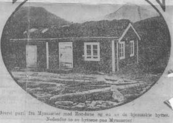
Øverst parti fra Mysusæter med Rondane og en av de hjemsoekte hytter. Nedenfor to av hyttene paa Mysusæter.

Billedteksten, som vi ikke vet om blir leselig, gjentas her: Øverst parti fra Mysusæter med Rondane og en av de hjemsoekte hytter. Nedenfor to av hyttene paa Mysusæter