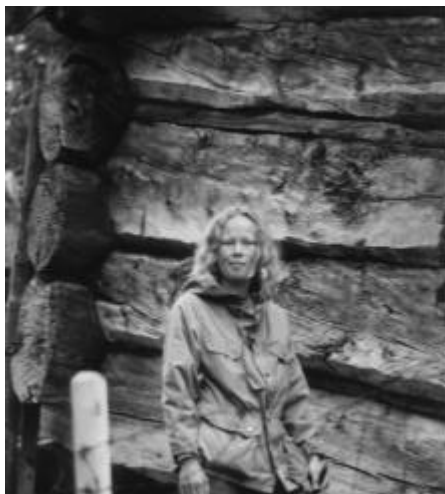
Tømmeret i Bottfjaset har usedvanlige dimensjoner.

døler som med små ressurser har gjenoppbygget og bevart et stort antikvarisk gårdsanlegg med mange "ulønnsomme" bygninger. For oss er det forstemmende å se hvordan landets rikeste eiendomsbesitter, Opplysningsvesenets Fond unndrar seg å benytte en bagatell av sin formue for å redde en av sine egne kulturhistorisk mest verdifulle bygninger.