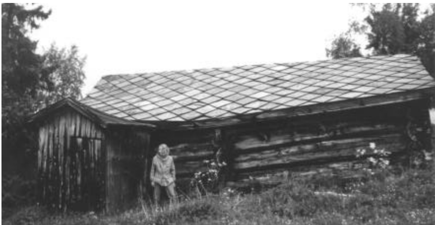
Bottfjoset har falt. (Åh– hva var det nå hun het igjen.)

Men hovedansvaret ligger hos eieren – Opplysningsvesenets fond. Det er et hån mot opplysningstidens idealer at Opplysningsvesenets fond lar plussordet ”opplysning” inngå i sitt navn. Fondet er en av landets største og i særdeleshet mest uansvarlige